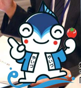
焼津市公認 マスコットキャラクター 「やいちゃん」

TEL:054-626-3366 FAX:054-626-3371 電話受付時間 平日9:00～18:00